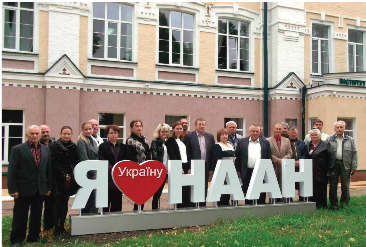
Члени Вченої ради інституту після чергового засідання (25 вересня 2018 р.)